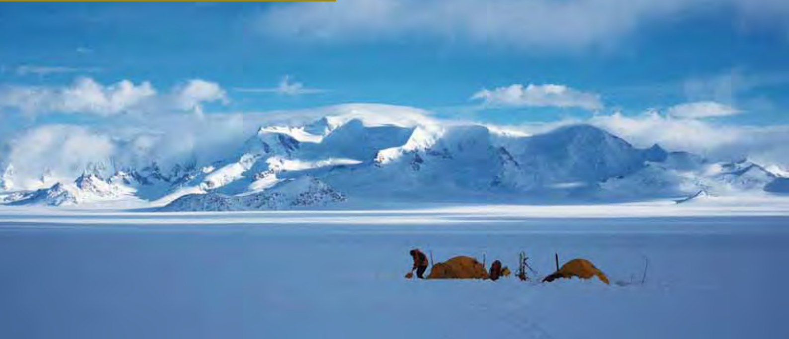
Unser Zeltlager mit Aussicht auf das Mariano Moreno-Massiv